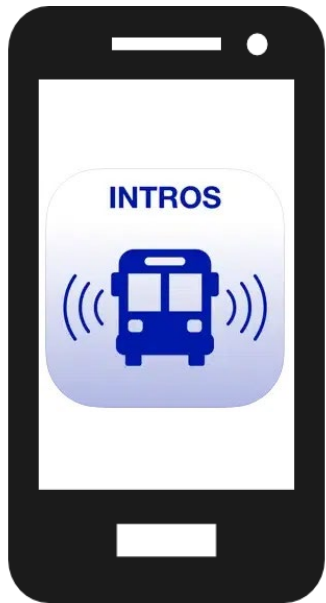
Intros, radar TP application des sbv